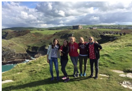
Sprachreisen, z.B. nach England oder Spanien