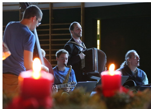
Projekte, Theaterbesuche, Kulturreisen