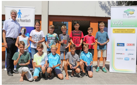
Georg-Awards für ausgezeichnete Schüler/innen