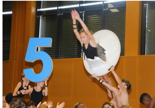
Wir feiern Geburtstag: 50 Jahre GvP