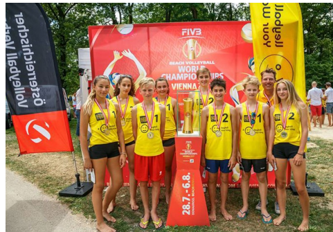
Bundes- und Landesmeister in vielen Sportarten, z. B. Volleyball, Schwimmen, Hockey, ...