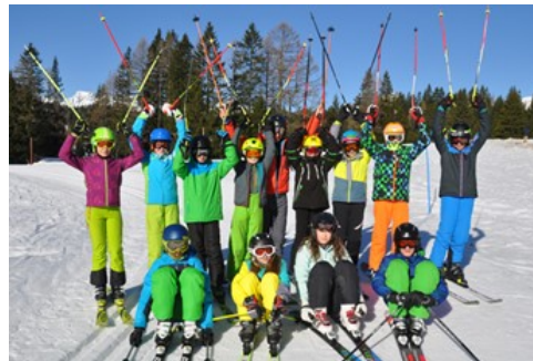
Schikurse und Sportwochen