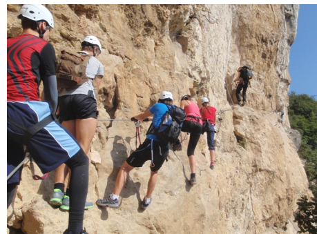
Sport in allen Facetten